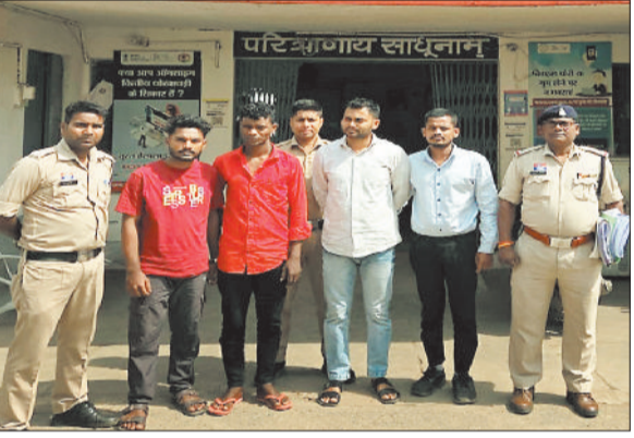
पुलिस गिरफ्त में आरोपी।