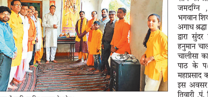
कार्यक्रम में उपस्थित विप्र समाज के लोग।

भगवान परशुराम ब्राह्मण विकास समिति द्वारा अक्षय तृतीया भगवान परशुराम प्राकट्य दिवस के सुअवसर पर विप्र हायर सेकेंडरी स्कूल सेमरा में 20 अप्रैल को सामूहिक सुंदरकांड पाठ एवं