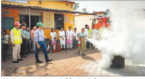
लोगों को जागरूक करते फायर एंड सेफ्टी विंग के कर्मचारी।