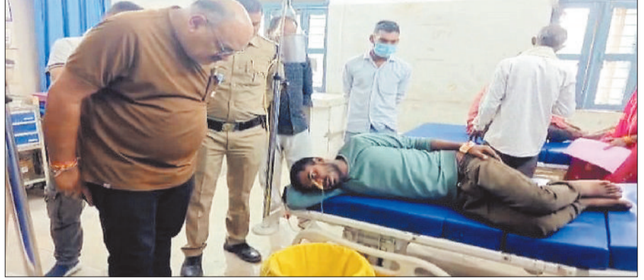
जिला अस्पताल में युवक से पूछताछ करती पुलिस।