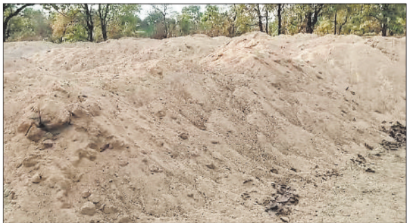
जब्त रेत का पहाड़

जिले में अवैध खनिज गतिविधियों पर रोक लगाने के लिए प्रशासनिक टीम इन दिनों एलर्ट मोड पर है। रेत के अवैध उत्खनन, भंडारण व परिवहन पर लगातार कार्यवाही की जा रही है। इसी क्रम में तहसील हसौद के ग्राम लालमाटी में रेत के अवैध भंडारण पर बड़ी कार्यवाही की गई। राजस्व विभाग की टीम ने मौके पर जांच के दौरान लगभग 50 ट्रिप ट्रैक्टर ट्राली