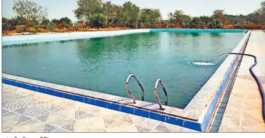
जांजगीर स्थित स्वीमिंग पूल।

जिला मुख्यालय जांजगीर में कहने को तो स्वीमिंग पूल की औपचारिक शुरुआत पिछले साल से हो गई है, लेकिन लंबे इंतजार के बाद शुरू हुआ यह स्वीमिंग पूल आम आदमी की पहुंच से काफी दूर हो चुका है। वर्तमान में यह स्वीमिंग पूल नगर पालिका द्वारा ठेका के माध्यम से संचालित किया जा रहा है। ऐसे में ठेकेदार द्वारा जिस तरह का शुल्क निर्धारित किया गया है, वह आम आदमी की जेब पर भारी पड़ने लगा है। बताया जाता है कि यहां 40 मिनट तैराकी के लिए कोई पहुंचता है तो इसके लिए 200 रुपए जमा करके रसीद कटवानी पडती है। यानि 4-5 सदस्यीय एक