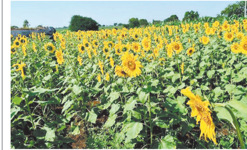
जांजगीर-चांपा। सक्ती क्षेत्र में इन दिनों सूरजमुखी के फूल खिलखिला रहे हैं। सड़क किनारे लगे फूल सहसा ही राहगीरों को अपनी ओर आकर्षित कर रहा है।