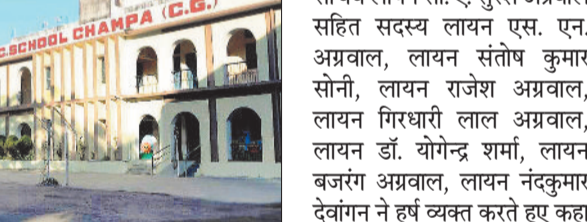
लायंस इंग्लिश हायर सेकेण्ड्री स्कूल भवन

अंतर्राष्ट्रीय समाज सेवी संस्था लायंस इंटरनेशनल की स्थानीय इकाई लायंस क्लब चांपा द्वारा